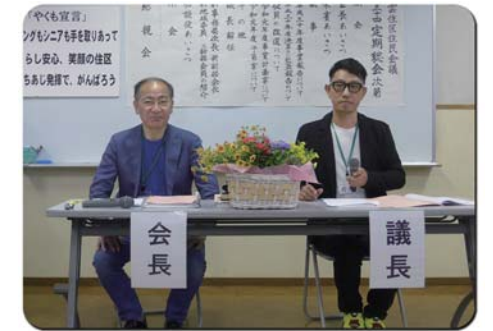
北澤会長と議長のPTA会長

3つ目は来年度以降の地域避難所運営訓練の進め方について の検討です。首都直下型地震が想定される中、実効性のある訓練 ができるよう、町会のみならず、キャンパス、学校、防災関係者 と協議していきます。 これ以外にも多様な地域課題がありますが、皆さんの協力を頂き ながら、粘り強く楽しく取り組んでいきます。今年1年、八雲住区を 引き続きよろしくお祈りいたします。