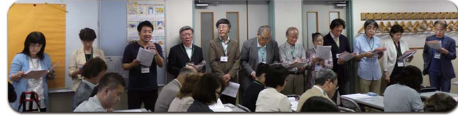
各部門長が並んで、令和元年度事業計画案を説明