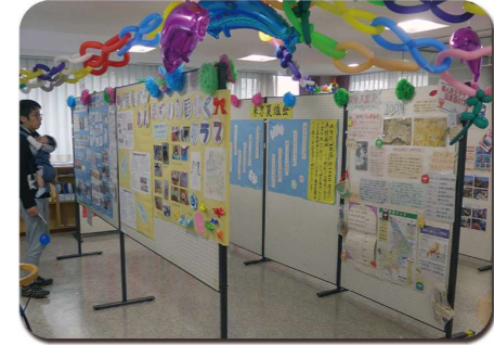
サークル作品や活動を紹介

久しぶりに参加する子ども達もゲームコーナーやスタンプラリーなどを楽しむことができました。