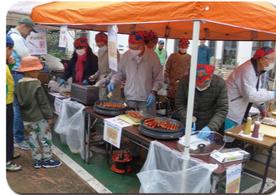
美味しい模擬店も