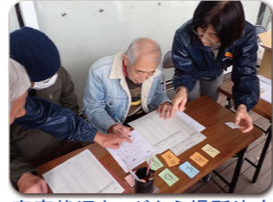
家計状況カードから場所決定