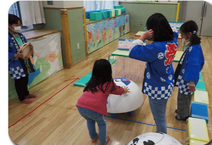
幼児向けもあります。ゲームコーナー