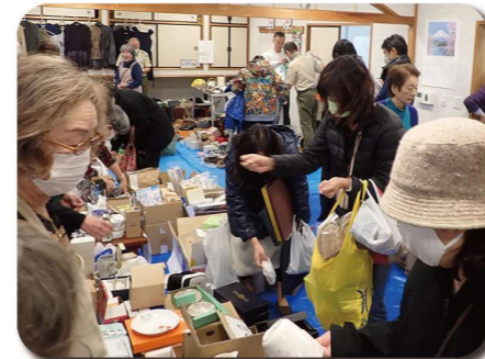
大賑わいのチャリティーバザー・フリマ