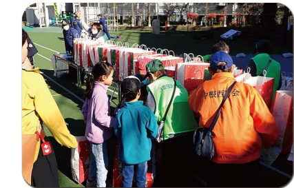
各訓練のスタンプを集めて最後にお土産をもらいました

避難所運営訓練は4班に分かれ、総務・情報班は避難者の受け入れ(検温→受付→記帳→避難者の避難場所への誘導)、施設・安全班は体育館の居住スペース区割り、簡易TENT、段ボールベッド組み立て、保健・衛生班は簡易トイレ、マンホール直結型トイレ組み立て、給食・物資班ではまかないくん(巨大湯沸かし器)を使ってアルファ化米、ハイゼックス米の調理、パック詰め・配布の訓練を行いました。