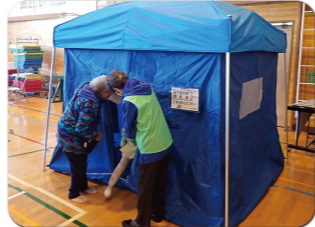
避難スペースには授乳 TENT も