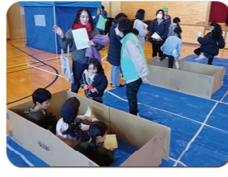
1人当たりの避難スペース確認