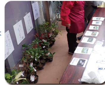
苗木の無料配布は大人気