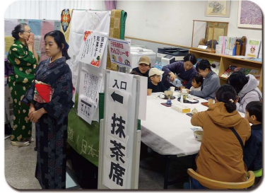
抹茶もいただけます