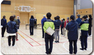
八雲体育館で訓練スタート