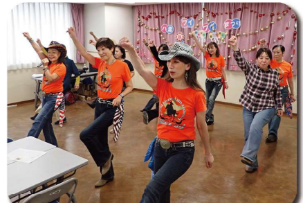
一緒に楽しいラインダンスを