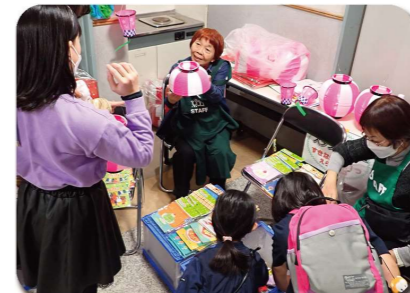
どれにしようかな?スタンプラリー賞品

今年度で委員長を退任いたしますが、皆様のご協力を戴き何とかやってこられました。心から御礼申し上げます。益々「ワイワイまつり」が盛大になりますよう！！