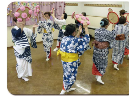
新舞踊を披露する皆さん