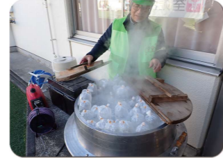
米と水をビニール袋に入れ熱湯で炊飯できるハイゼックス米

在宅避難者や一般避難者、体の不自由な方などの受付 今回は大勢の一般見学者に参加をしてもらえよう、通常の避難所運営訓練に加え、子供向け景品付きスタンプラリー、地震体験(起震車)及び、煙体験コーナーを設置しました。このため多くのファミリー(約200人)の参加がありました。