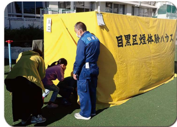
校庭には、煙体験や起震車による地震体験も