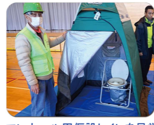
マンホール用仮設トイレを見学