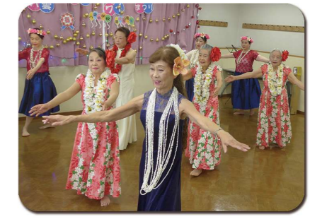
優雅なフラダンスもあります