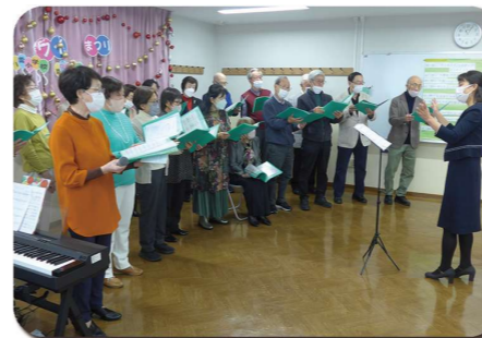
素敵な合唱を披露

ワイワイまつりはここ数年、コロナ禍で中止や変則的な開催が続きましたが、4年ぶりに11月12日に以前のように模擬店や子ども達も参加しての開催となりました。