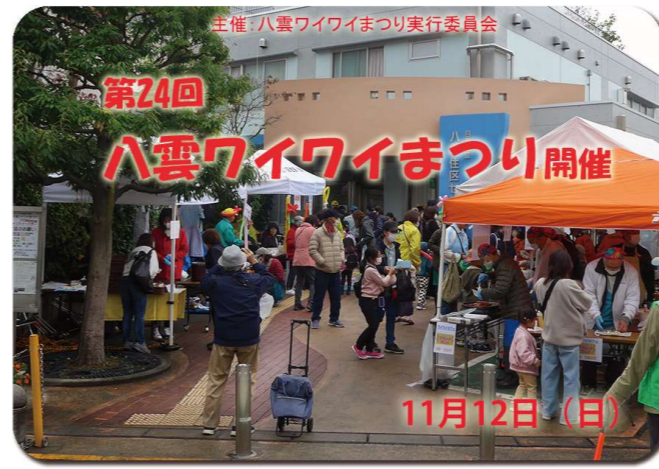
模擬店で賑わう広場

まだコロナ禍が完全には収束していない状況なので、訓練はコロナ対応を基本としましたが、今回は参加人数を制限せず、町会の方々や一般見学者の参加を受け入れ、班員、防災課、参集職員、八雲小PTA、日黒消防団第11分団団員を含めて、約260名が参加しました。