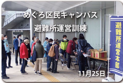
避難者を受け入れと誘導を訓練

今回、多くのヤングファミリーの参加があり、避難所運営訓練の重要性を感じていただけたと思います。また各班員は訓練内容を見学者に説明することにより、業務の習熟度向上につなげることができました。