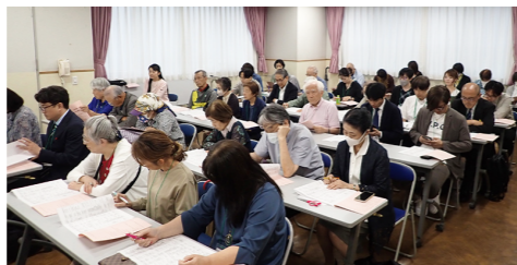
議事内容を熱心に聴く参加者