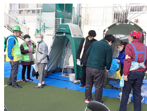
災害時のトイレ対策を紹介