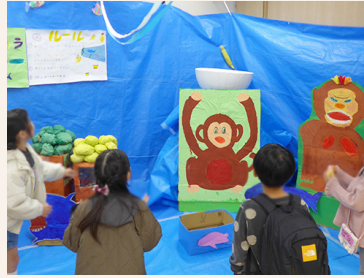
「サル・ゴリラ・チンパンジー?入れ」ゲーム