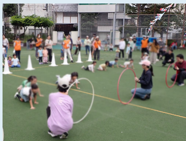
親子でくぐろう! (3歳以下の親子)

ご協力いただきました八雲小学校の校長先生はじめ教職員やPTAの方々、本当にありがとうございました。