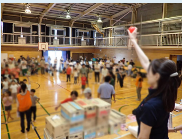
突撃!八雲の晩ごはん