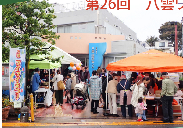
模擬店で賑わう広場

また、祭りを通じて地域の参加者・来場者同士の交流の輪が広がり、笑顔あふれる温かい場となりました。