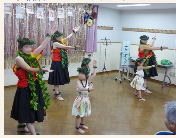
幼児も一緒にフラダンス披露