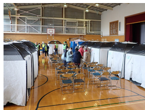
屋内型テントを多数設置