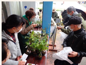
苗木の無料配布は大人気