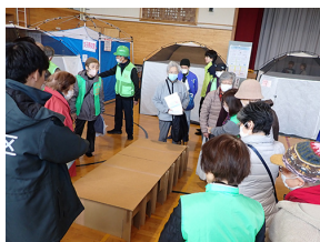
段ボールベッド組み立て体験

今回はわかめご飯のアルファ化米の他、災害用炊飯袋ハイゼックス炊飯袋を使い米を炊き出し致しました。召し上がっていただいた皆さま、ハイゼックス米の感想はいかがでしたでしょうか?