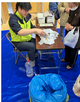
簡易トイレ利用法を実演

避難者が1階で受付後、Noプレートをもらい2階体育館の自分のテントに到着するまでのルート案内と多数のテントが林立した場合に体育館内の夜間行動がスムーズに行なえるための非常用夜間照明器具の設置場所と数の作業を点検しました。実際に発災した場合の手順が明確になり参考になりました。