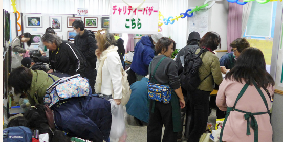
大賑わいのチャリティーバザーコーナー