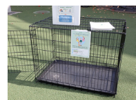
ペット用ゲージ展示