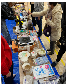
在宅避難の必要グッズを 展示説明