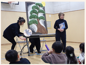
子どもたちや保護者もお話に集中