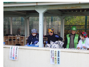
ハイゼックス米などを参加者に配布