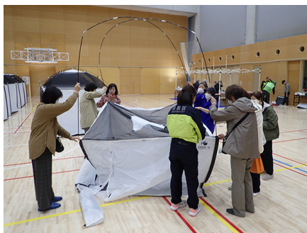
テントを4人で簡単に組み立て

加えて、毎回の訓練の度に行われる簡易トイレの使用のレクチャーと在宅避難の際に有効な器材や食品等を展示説明するコーナーもあり、来館者の方には参考になったと思います。