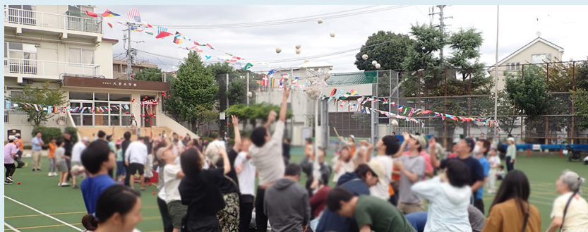
カゴの穴を小さくした玉入れ(小学4年~大人)