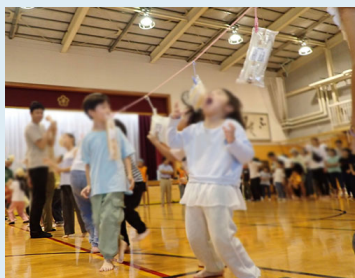
最後は「パン食い競争」で盛り上がり