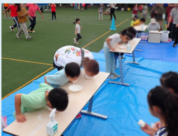
口でくわえて「マシュマロで真っ白」