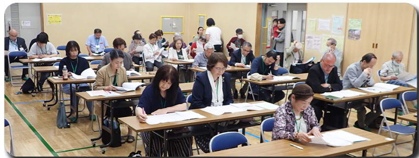
熱心に議事内容を聴く参加者