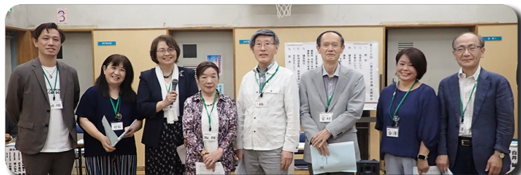
各部門の代表が事業計画案を説明